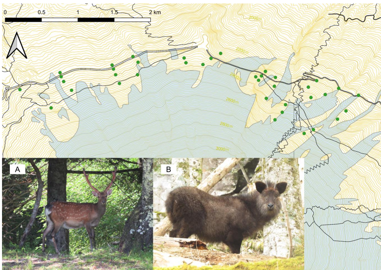
図1：富士山森林限界周辺のカメラ設置地点（緑点）とニホンジカ（A）とニホンカモシカ（B）。黒線は登山道、水色は高山帯を意味する。